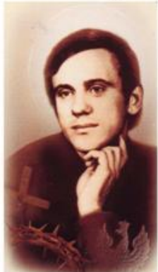
Nowy błogosławiony męczennik naszych czasów ks. Jerzy Popiełuszko (1947-1984) Beatyfikacja: Warszawa, 6 czerwca 2010 r.

6 czerwca br. na pl. Józefa Piłsudskiego w Warszawie odprawiona została uroczysta Msza św. beatyfikacyjna, w trakcie której do grona świętych i błogosławionych Kościoła Katolickiego włączony został ks. Jerzy Popiełuszko.